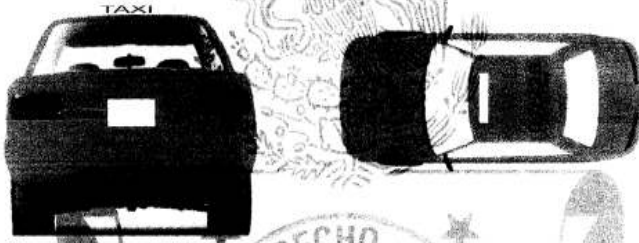
Figura 1.- Vista trasera del vehículo tipo.