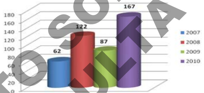
Fuente: Base de datos de Homicidios Presuntamente Relacionados con la Delincuencia Organizada, Centro Nacional de Planeación, Análisis e Información para el Combate a la Delincuencia Organizada, 2011. También se puede revisar en http://www.presidencia.gob.mx